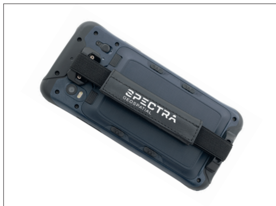
MobileMapper 60 portátil con software MobileMapper Field