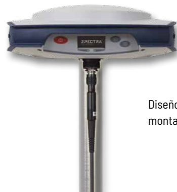
Diseño patentado de antena UHF montada dentro de la mira